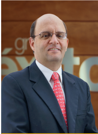
Miembro independiente Primer nombramiento: 30/03/2016

la Regla Fiscal del Ministerio de Hacienda. Ha participado y liderado foros e investigaciones en temas relacionados con sostenibilidad, diversidad, inclusión y liderazgo femenino. Es miembro de la Junta Directiva desde marzo de 2014.