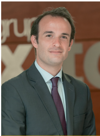
Miembro Patrimonial Primer nombramiento: 30/03/2016

Actualmente es miembro del Comité Ejecutivo y Director de Mercadería del Grupo Casino. Ha sido Presidente de Distribution Casino France, Director de Via Varejo y Director Adjunto en Euris Group. Secretario General de inversiones económicas y sociales del Departamento del Tesoro. Se ha desempeñado como: Consejero representante de los tribunales de Estado de la ASF, Sanef, ATMB, Afrtp Epamarne, SNCM y STIF. Ejerció como alto funcionario del Ministerio de Economía y Finanzas. En el Grupo Casino ha desempeñado funciones como Director Estratégico y de Planeación y Secretario del Comité Ejecutivo.