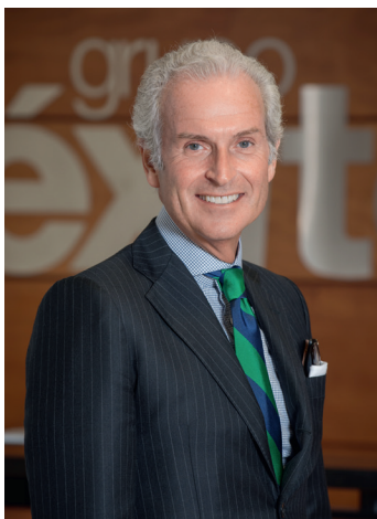
Miembro independiente Primer nombramiento: 11/10/2010 Última reelección: 30/03/2016

Su experiencia y conocimiento en el sector financiero y de fondos de inversión son aportes fundamentales para la dirección estratégica y de expansión de la Organización.