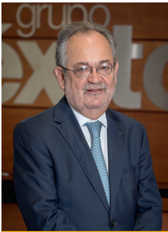
Miembro independiente Primer nombramiento: 11/06/2015 Última reelección: 30/03/2016