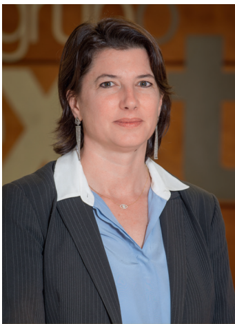
Miembro independiente Primer nombramiento: 20/03/2014 Última reelección: 30/03/2016

Fue Gerente General de Interconexión Eléctrica S.A. –ISA–, Presidente de Asofondos, Presidente de la Flota Mercante Grancolombiana, Ministro de Hacienda y Director Ejecutivo del Banco Interamericano de Desarrollo. Ha sido miembro de diversas juntas directivas incluyendo: Avianca, Banco de Bogotá, Bolsa de Valores de Colombia, Bavaria, Caracol S.A., Cafesalud, Valores Bavaria y Caracol Televisión. En la actualidad es Presidente de la Junta Directiva de Almacenes Éxito S.A., Grupo de Inversiones Suramericana S.A. –SURA– y del Consejo Superior de la Universidad de los Andes.