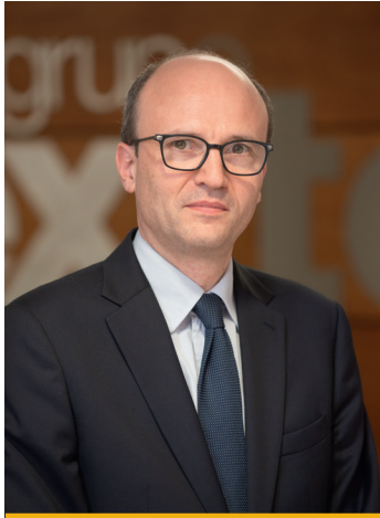
Miembro Patrimonial Primer nombramiento: 30/03/2016